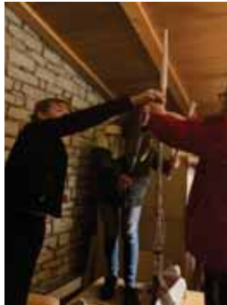
Welche Gruppe baut den höchsten Turm aus Zeitungspapier?

- „Ich fand cool, dass wir einen kleinen Film geschaut haben und Spiele gespielt und Plakate beschriftet haben, wie z.B. welchen Wochentag magst du am liebsten.“ – Nora