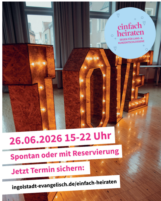
Grafik Dekantat Ingolstadt

Sie sind eingeladen Ihre Liebe zu feiern. Stressfrei, unkompliziert, aber trotzdem mit Gottes Segen. Zu zweit oder mit der Familie, alle sind willkommen. Reservieren Sie sich einen Termin oder kommen Sie am 26.06.2026 spontan vorbei.