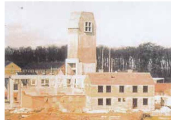
Die Apostelkirche im Rohbau